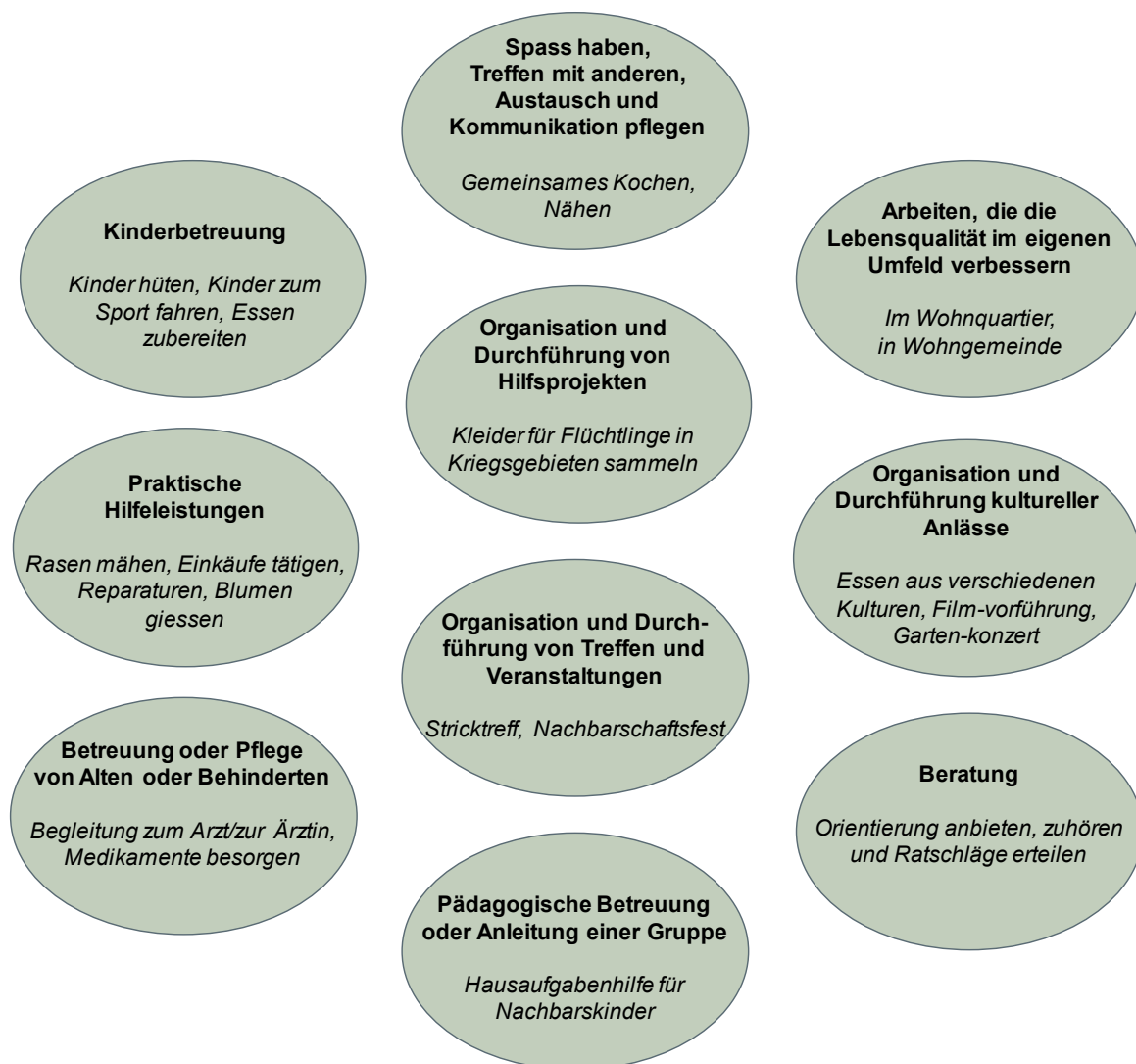
D 2.2: Betätigungsfelder der informellen Freiwilligenarbeit

Quelle: Darstellung Interface, in Anlehnung an die Kategorisierung des Freiwilligenmonitors (Freitag et al. 2016).