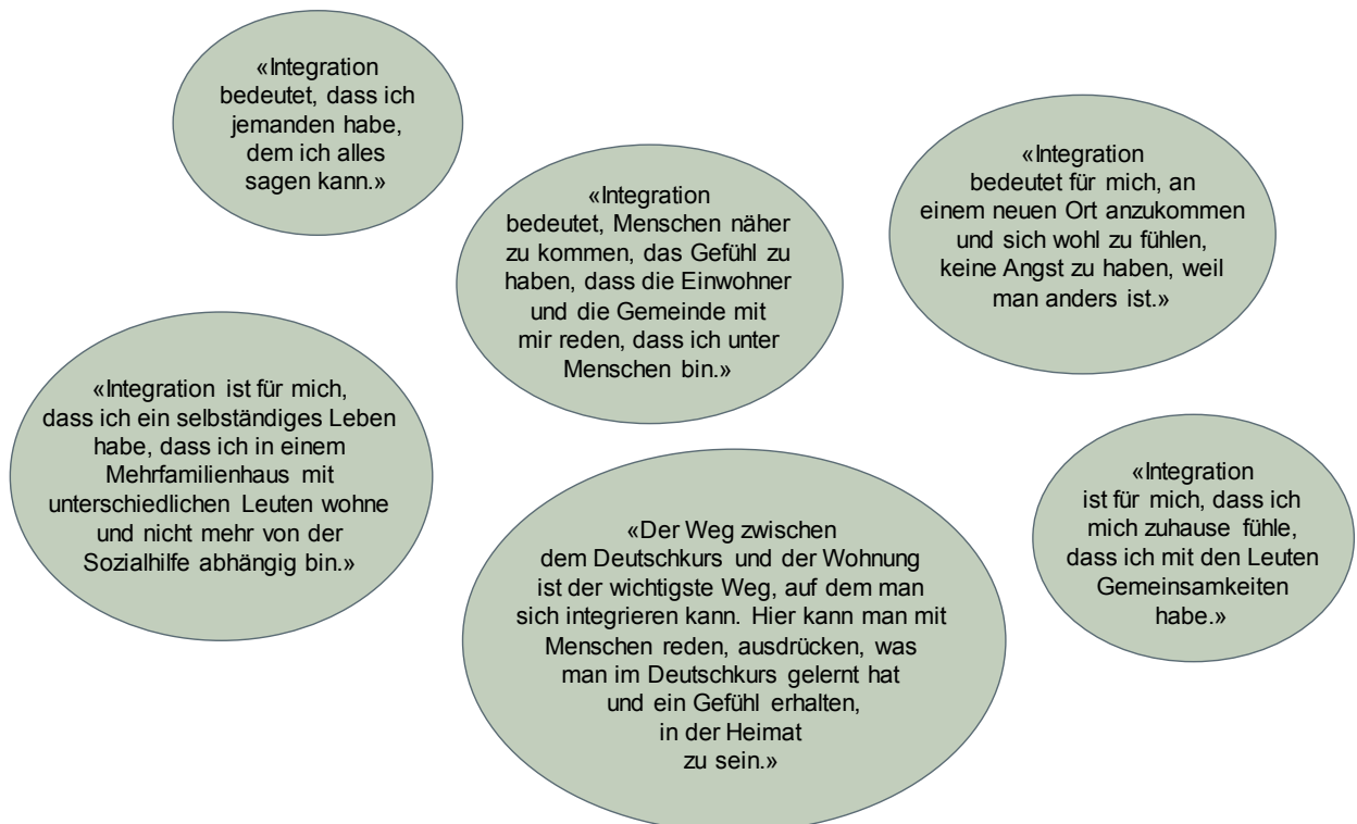
D 4.1: Zitate der neu Zugewanderten zur seelisch-emotionalen Dimension des Konzepts «Integration»